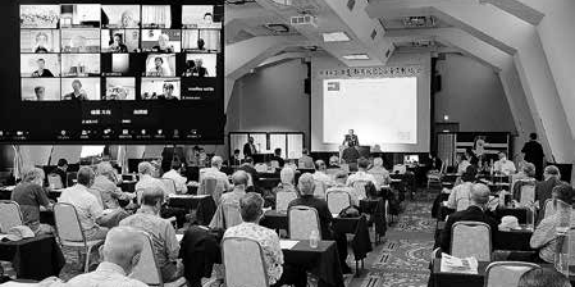
会場とリモートのハイブリッド総会を開催

さらに、二〇二二年には「総会でもリモート参加を実現したい」という声から、機材の手配だけでなく、リモート参加希望者へのセットアップ情報の提供も行った結果、形の上では「会場とリモート」のハイブリッド総会の開催を実現した。