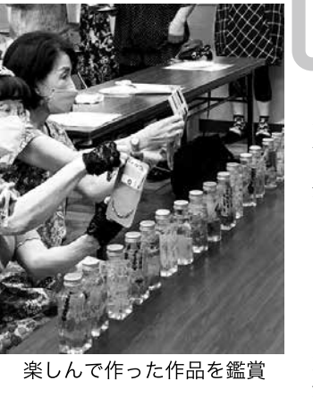
楽しんで作った作品を鑑賞