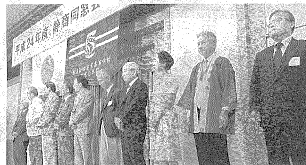
会費の目標額を達成した回卒に感謝状が贈られた。