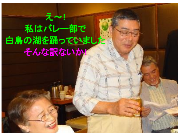
え〜！ 私はバレー部で 白鳥の湖を踊っていました そんな訳ないかい