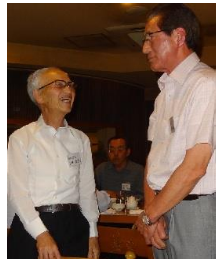
皆さんの近況報告・ 昔談義はとても楽しかったです