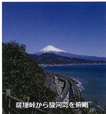
薩埵峠から駿河湾を俯瞰

参加者は名古屋から東京まで様々です。由比駅でスタンプを押して数に応じて景品が出ます。皆様も郷土の景勝地を探勝しましょう。