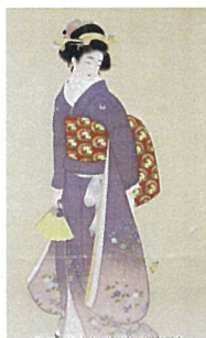
特別展 名都美術館開館25周年記念 麗しき女性の美 上村松園・鍋木清方・伊東深水 前期 2024年10月6日(土)～11月11日(日) 後期 2024年11月13日(水)～12月16日(日) 観覧時間 10:00～17:00 休館日 毎週月曜日 入館料 大人1,000円(小学生以下500円) 名都美術館

昨年12月に知人に誘われ、愛知県長久手市にある「名都美術館」を初めて訪れました。