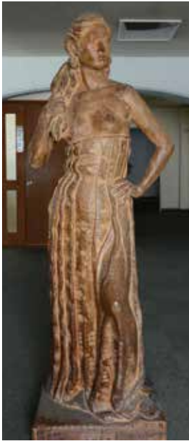
「希望」(木彫) 静岡高校・所蔵 昭和27年 日展出品