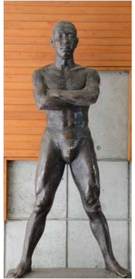
「新生」昭和36年制作(石膏)

この像を制作した前年は静岡野球部が甲子園で法政二高に敗れて全国大会準優勝した年であった。私は、豆陽中学時代(現・下田北高)に5年間捕手をしていたので、静岡に奉職してからは大いに応援したものである。準優勝のメンバーが卒業して新メンバーになり、夏の大会に望むに当たり新メンバーに対する希望と激励の気持ちで作ったのがこの像「新生」である。後日、縁あって静岡の野球部長を16年間勤めることになった。