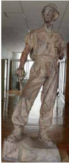
「登山の像」(木彫) 静岡商業・所蔵